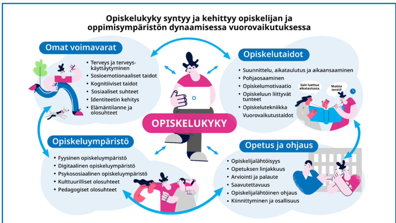
Kuvio 2. Opiskelukyvyn eri osa-alueet (Kunttu 2006)

Kun oppimisen tuessa korostuu varhainen ja matalan kynnyksen tuki, tarkoittaa se sitä, että tuessa on huomioitava kaikki kuvio 2. määritellyt opiskelukyvyyn osa-alueet.